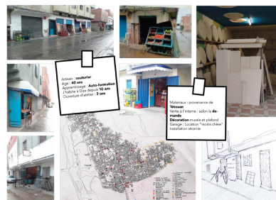
Activités commerciales et artisanat.